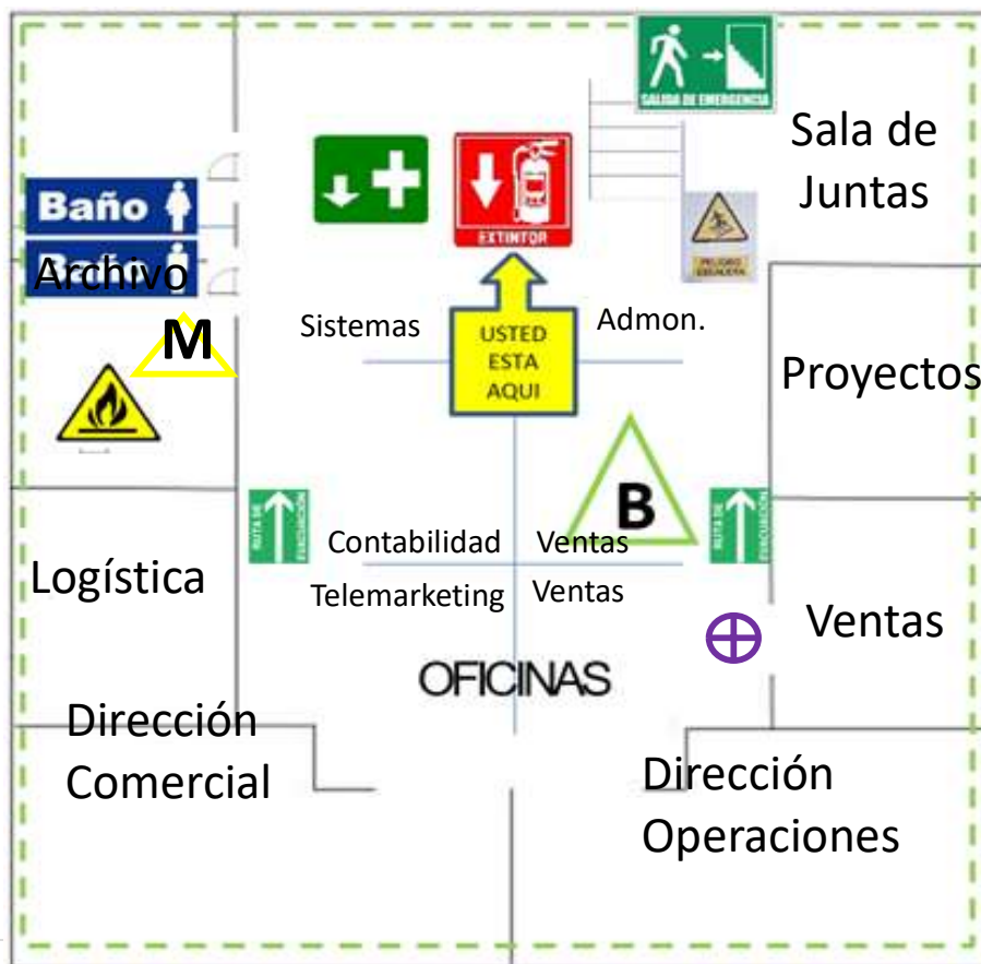
PLANTA ALTA - OFICINAS